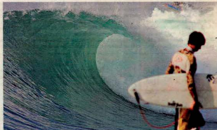
Imagen de una de las olas que se pueden ver en la playa de Bingin