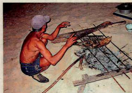
Un nativo prepara pescado en la playa de Bingin

■ El vuelo parte de Madrid a Kuta, vía Londres y Singapur.