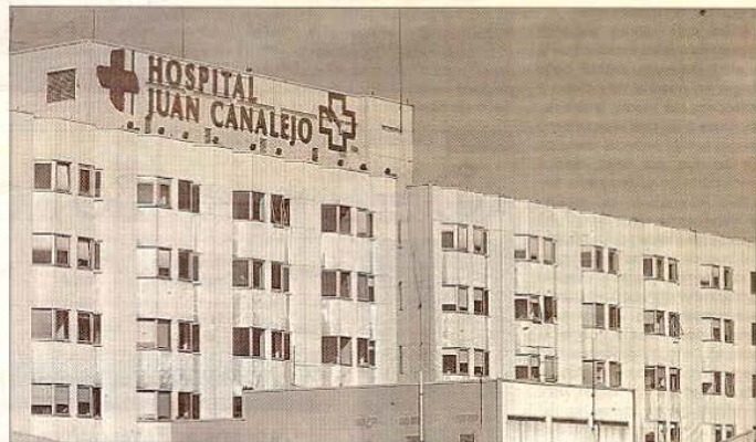
Centro Hospitalario Juan Canalejo.

Todas estas conferencias evidencian el interés del Colegio Oficial de Médicos de A Coruña por mantener un ritmo constante en la formación permanente de sus integrantes. Tras convertirse en un hito gracias a un proyecto de 1989, continúan dándole a la preparación de sus profesionales la importancia que merece, sobre todo teniendo en cuenta la incidencia que su oficio tiene en la sociedad.