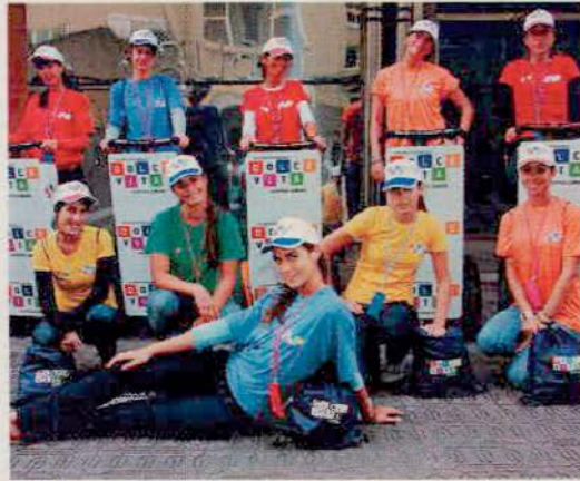
Las diez ázafatas que reparten el «merchandising» de Dolce Vita

Dolce Vita. Desde el pasado fin de semana, diez chicas recorren el paseo marítimo, la plaza de María Pita, los jardines de